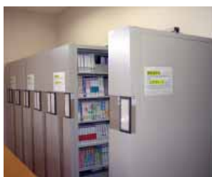
視聴覚資料 Audio-Visual materials