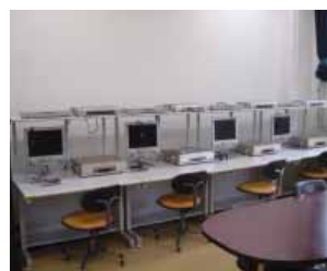
個席視聴覚室 Audio-Visual booths