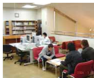
ブラウジングコーナー Browsing Corner