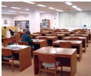
雑誌閲覧室 Periodicals Room