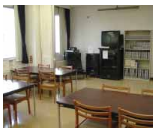
グループ視聴覚室 Audio-Visual Room