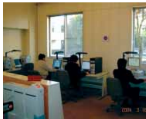
情報検索コーナー Information Retrieval Corner