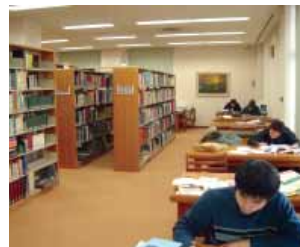
図書閲覧室 Reading Room