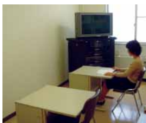
学習室 Study Room