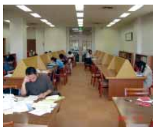
参考図書室 Reference Room