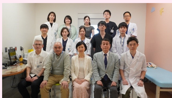
子どものこころ診療部メンバー